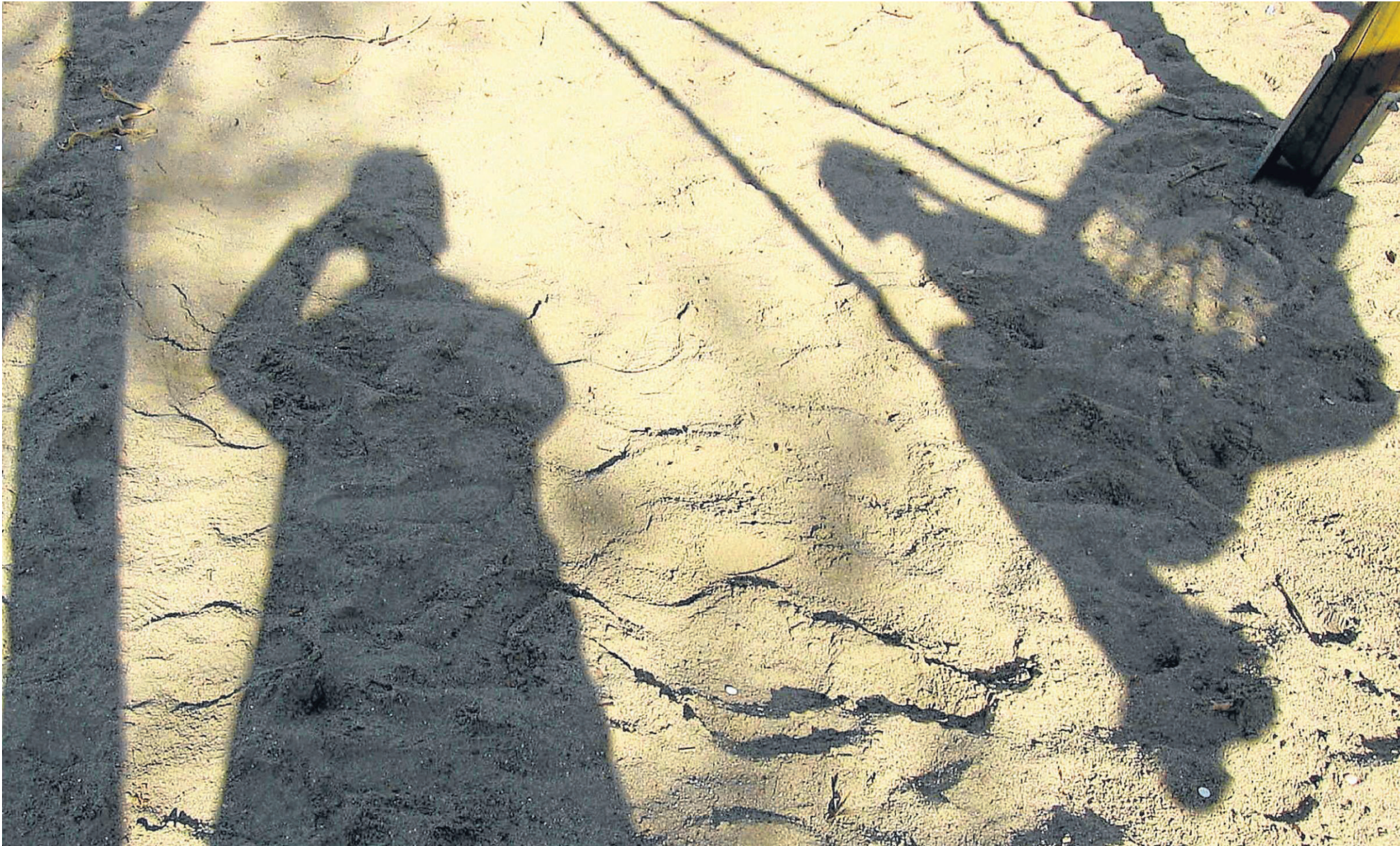
Dunkelfelder: Ein schaukelndes Mädchen und ein Mann werfen einen Schatten auf den Sand eines Spielplatzes. Jeder hundertste Mann soll pädophile Neigungen haben.